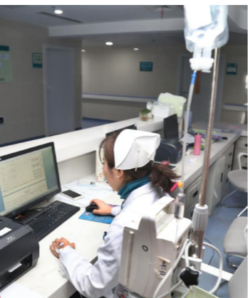
像这样舍小家为大家、爱岗敬业无私奉献的场景和画面,每天都在医院的各个病区、各个角落上演。白衣天使没有惊天动地的壮举,也没有轰轰烈烈的事迹,有的只是默默的坚守、耐心的倾听、温馨的呵护、亲人般的关爱……她们用柔弱的肩膀担起了惠及民众的道义和责任,维护了医学的圣洁和荣誉;她们用娴熟的护理技术、热情周到的服务、纯洁善良的心灵,赢得了广大群众的认可和信任,成为了新时代文明的践行者。(宣传科 刘义云)